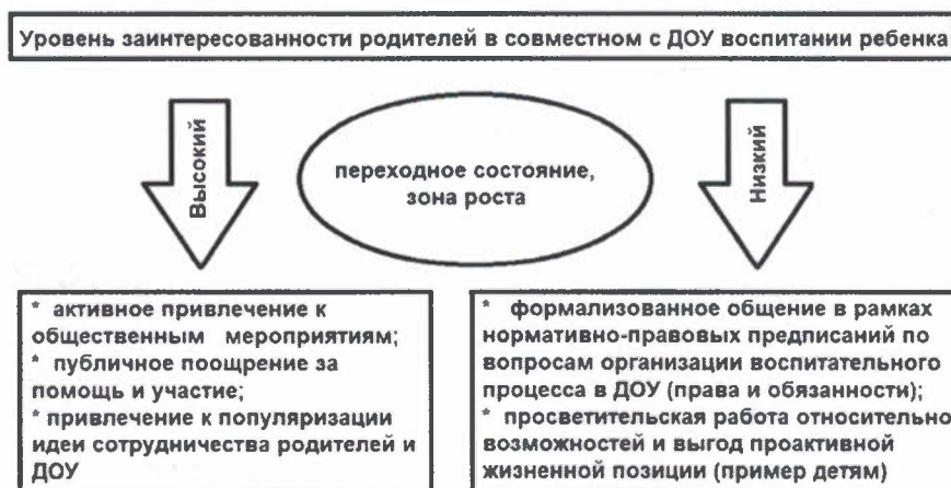
Рисунок 1 – Особенности вовлечения родителей в совместный воспитательный процесс с учетом их заинтересованности в сотрудничестве

На рисунке 1 представлена схема распределения внимания сотрудников ДОО при общении с родителями воспитанников на основе учета фактора заинтересованности родителей в вопросах сотрудничества.