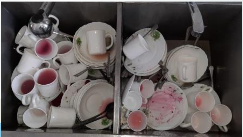
Нерациональное размещение грязной посуды в моечной комнате