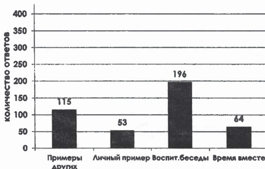
Рисунок 1 – Результаты анкетирования

Полученные результаты графически отображены на рисунке 1.