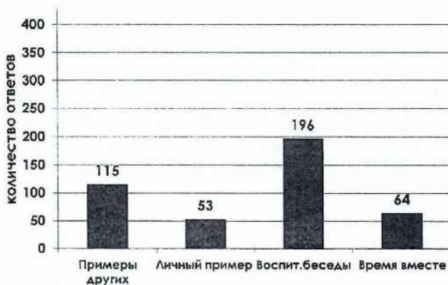
Рисунок 1 – Результаты анкетирования

Полученные результаты графически отображены на рисунке 1.