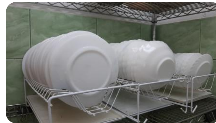
Сокращение времени при мытье посуды