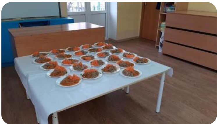
Использование раздаточного стола в групповой комнате