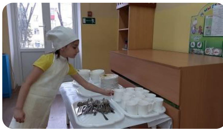
Использование алгоритма при уборке грязной посуды детьми