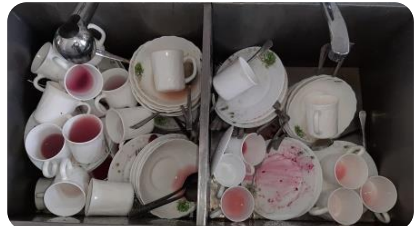
Нерациональное размещение грязной посуды в моечной комнате