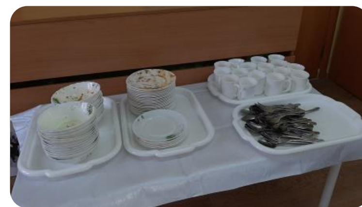
Сокращение времени при уборке посуды