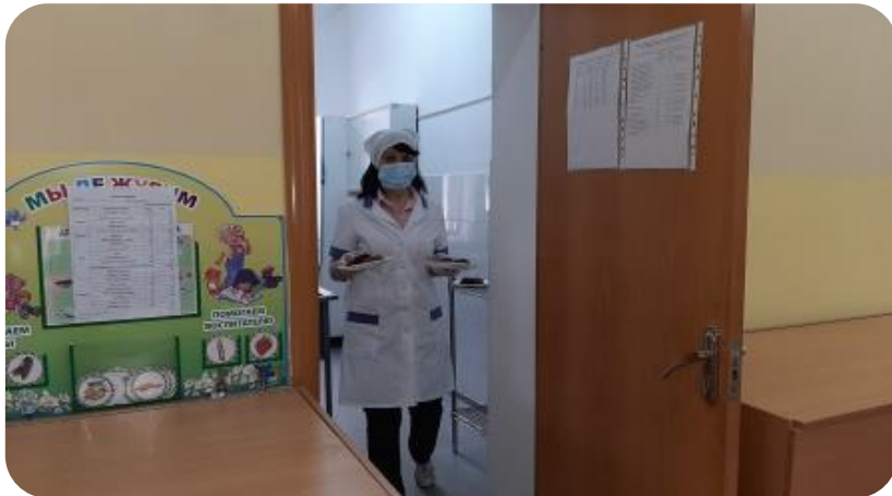
Потеря времени при смене блюд