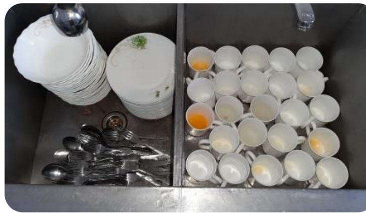
Рациональное размещение грязной посуды в моечной комнате