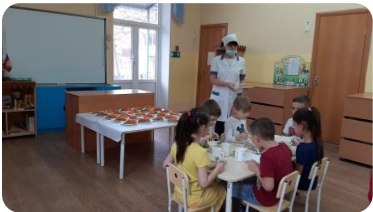
Сокращение времени при смене блюд