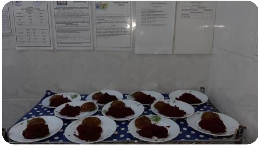
Использование раздаточного стола в моечной комнате