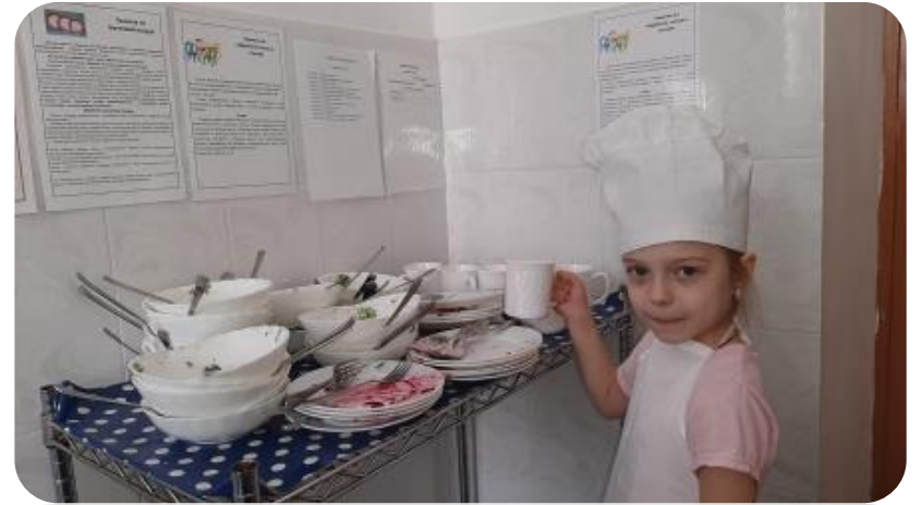
Отсутствие алгоритма уборки грязной посуды детьми